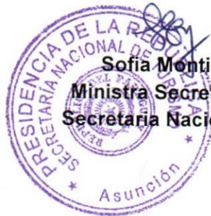
Sofía Montiel de Afara Ministra Secretaria Ejecutiva Secretaría Nacional de Turismo