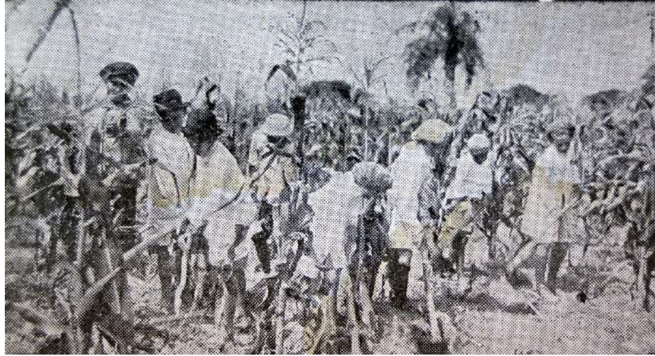
Huerta de la Escuela Graduada de Villa Morra, Asunción.