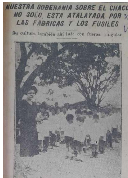
Imagen: Docente y alumnos de la escuela de Bahía Negra. El Diario, 19 de marzo de 1932, p. 1.

A inicios de la década de 1930 fue creada la escuela de Puerto Pinasco, en virtud de la norma que exigía a las empresas la habilitación de escuelas primarias en sus áreas de influencia.