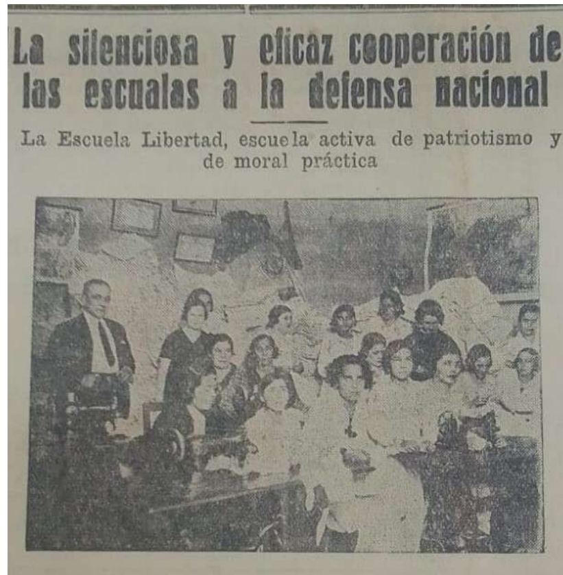
Docentes y alumnas de la Escuela Libertad, en tareas de costura. El título de “Silenciosa pero eficaz”, quizás no haga justicia del todo a la alta visibilidad que tenían las contribuciones escolares. El Diario, 13 de junio de 1934.

Leche para el Soldado Herido ; la Comisión de Asistencia a Prisioneros Paraguayos , y otros programas de apoyo al ejército, o a los combatientes heridos y/o lisiados, así como a la Cruz Roja, como ya se vio.