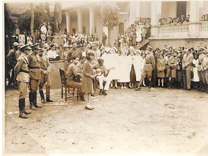
Niña cantando ante tropas y enfermeras prestas a partir al Chaco, en el patio de la antigua Escuela Militar, ca. 1932.

No parece haber sido desarrollada en las escuelas del Paraguay una Pedagogía de la Guerra, sistemática, específica, al modo de la Kriegspedagogie que se desarrolló en Alemania durante los años de la primera Guerra Mundial 31 . Por el contrario: la tesis de que el Paraguay estaba defendiéndose abonó la idea de un país pacífico obligado a ir a la guerra. 32 Como se verá después, lo que sí contenían los textos escolares y los mapas, eran los argumentos sobre los que el Paraguay basaba sus derechos sobre el Chaco.