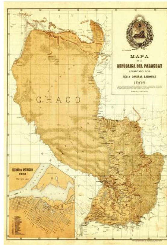
Mapa del Paraguay, de Félix Daumas Ladouce, 1906.

En 1906, el Consejo Nacional de Educación aprobó el uso del mapa elaborado por Félix Daumas Ladouce, a partir de las definiciones de límites propuestas por Alejandro Audibert en su obra Exposición de los Derechos del Paraguay en la cuestión de límites con Bolivia, trabajo que, si bien concluyó en 1890, no fue publicado sino hasta 1901.