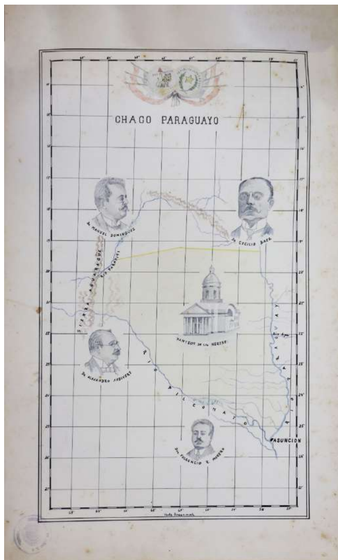
Mapa del Chaco paraguayo. Trabajo realizado en la Escuela República Federativa del Brasil, en 1940, sobre la base del texto La Ruta, de Justo P. Benítez.